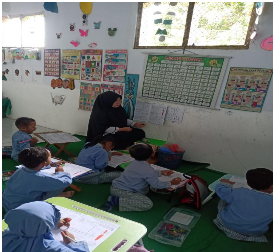
Guru membacakan peraga dan murid mengikuti