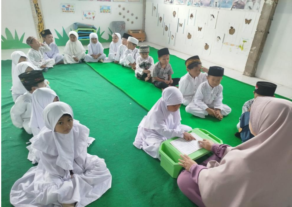
Murid maju satu persatu untuk membaca Al-Quran dengan metode Tilawati