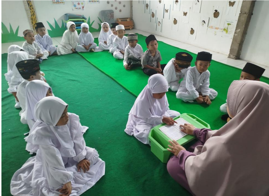
Murid maju satu persatu untuk membaca Al-Quran dengan metode Tilawati